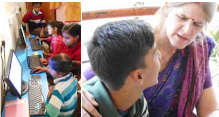
Rotary Club Amsterdam Zuidas schonk nieuwe computers