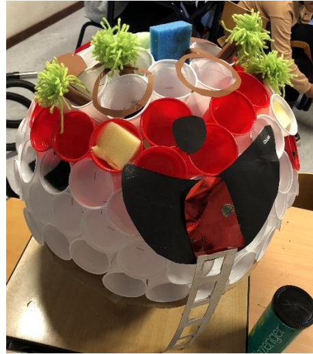
Masterclass 'Wie ben ik, wat kan ik'

Tijdens deze masterclass stond de leerling centraal: Wie ben ik en wat kan ik!