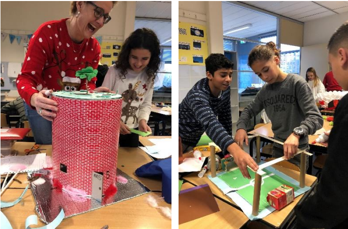
Samenwerken lukt erg goed!

De groepjes hebben hard gewerkt en mooie ontwerpen gemaakt. De laatste les kregen zij de kans hun plannen te pitchen. Wat een talent hebben we op deze school!